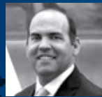
Fernando Zavala Presidente del Consejo de Ministros