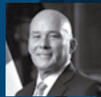
Eduardo Ferreyros Ministro de Comercio Exterior y Turismo