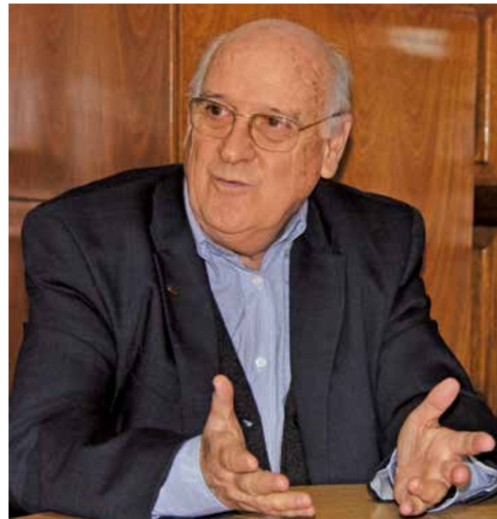
Padre Jerónimo Olleros, Director General de Fe y Alegría.

Con respecto a las dificultades que se interponen en el camino de este movimiento educativo, el capital económico representa el factor más complicado. Pese a que tienen sedes en 20 regiones de las 26 que tiene el país, aún hay muchos lugares con grandes ne-