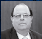
Julio Velarde Presidente del Banco Central de Reserva