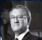
Alfonso Grados Ministro de Trabajo y Promoción del Empleo