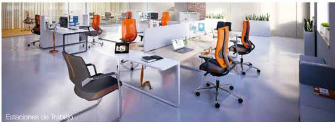
Estaciones de Trabajo

División Corporativa | San Patricio 550 - Chorrillos / Tel: 203 0600