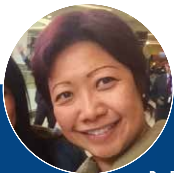
Por Eugenia Mont

Directora de contenidos en SAXO Yo Público