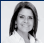
Mercedes Araoz Segunda Vicepresidenta de la República