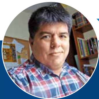
Por Roberto Bustamante Director Lab Docente