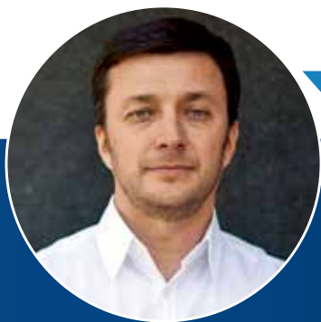
Por Jorge Marsino Director de Marsino Arquitectura