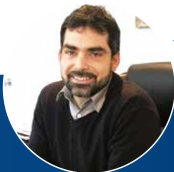
Por César Oré