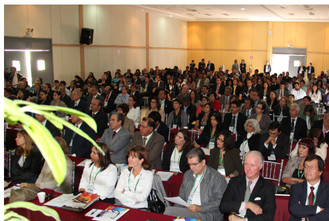
Auditorio Carlos Mariotti, CADE por la Educación 2012