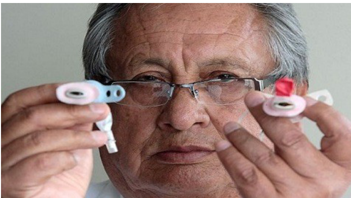
Cánula de traqueotomía, creada por el Dr. Oscar Patiño

Entre 1,000 inventos de todo el mundo, dos innovaciones peruanas han sido galardonadas en la reciente edición del Mundial de Inventos en Ginebra, evento organizado por la Organización Mundial de la Propiedad Intelectual.