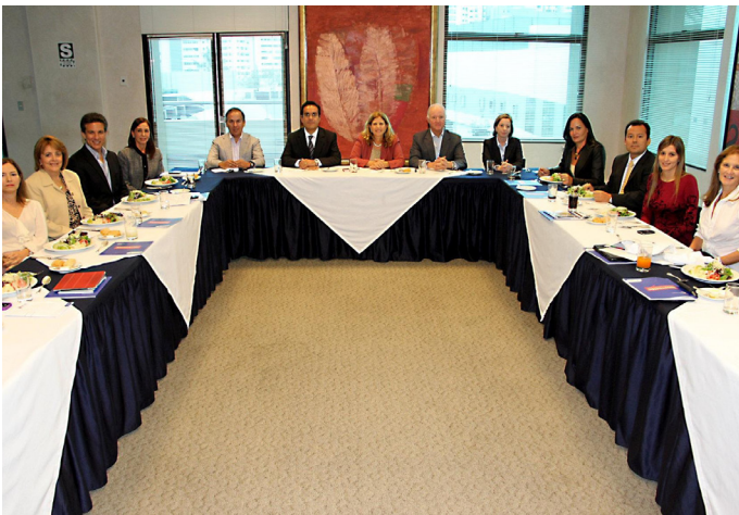
Directorio IPAE 2012-2013